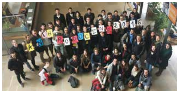
École thématique Anthropocène - 2016