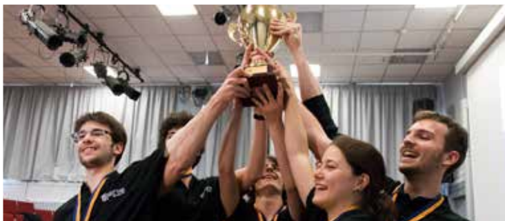
Tournoi international de Physique - 2016

Le qualificatif de normalien s'applique à tous les étudiants inscrits au diplôme, normalien élève pour les admis sur concours, normalien étudiant pour les admis sur dossier.