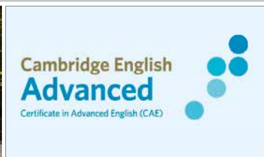
Cambridge Advanced English