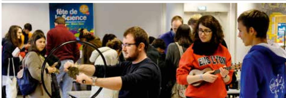
Fête de la Science

Renseignements sur : www.ens-lyon.fr/formation/admission