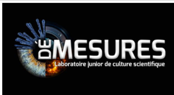
Laboratoire junior DéMesures